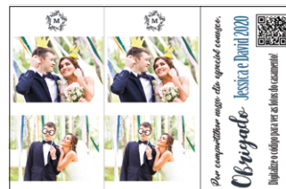
10x15cm, corte de 5cm